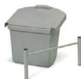
629362 NKA130—Kit collecteur 30 L pour NK