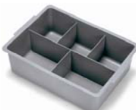
627582 rangement com- partimenté pro- fondeur 120mm