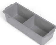
627580 Demi-rangement profondeur 120mm