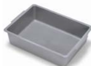
627581 rangement profondeur 120mm