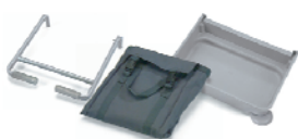
629397 NKA100—Kit extension sac 100 L pour NK