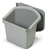
629415 collecteur 30 L avec couvercle pour NK