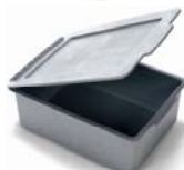
627583 Rangement avec couvercle prof- deur 120mm