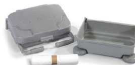
629448 NKA101—Kit complet sac plastique 120 L